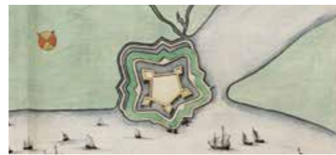
Fort Lillo rond 1650

Dit Europees project wil oude stadswallen in vestingsteden een nieuwe toekomst geven. Ook Zandvliet en Lillo worden de komende drie jaar onder de loep genomen.