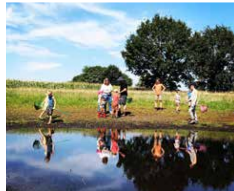
Waterdierjes en verkoeling zoeken tijdens de zomerse picknick aan een Brechts venmetje.

Vennen vragen onderhoud, anders slibben ze dicht. Zeven private eigenaars lieten hun ven herstellen. Op drie druk bezochte publieksevenementen maakten buurtbewoners en geïnteresseerden kennis met deze verborgen pareltjes.