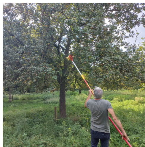
Fruitvariëteiten op naam brengen

De tiendelige fruitcursus van de Nationale Boomgaardenstichting streek neer in onze contreien, de Sapmobiel perste kilo's appels en RLDV startte met het structureel beheer van openbare boomgaarden.