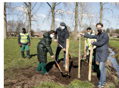
Persmoment met burgemeester en gedeputeerden

De grasmatten werden uitgerold in de Van Heymbeeklaan in Deurne. Samen met 40 bakken vol bomen en planten zorgden ze voor een groener uitzicht van de voorheen doffe, grijze straat. De proefopstelling werd via een intensief participatietraject bijgestuurd en binnenkort krijgt de straat een definitief groenere inrichting.