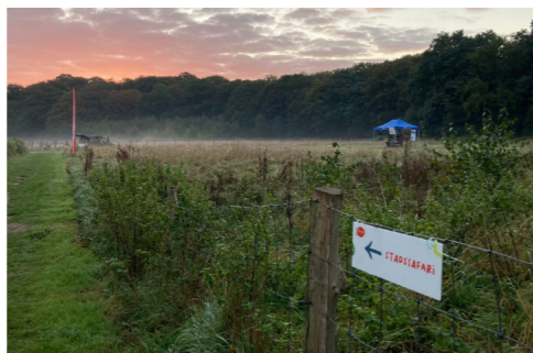
Op ontdekking in beschermd landschap Ertbrugge in Deurne

Met #beleefdevoorkempen zetten we mensen aan om op verkenning te gaan in de streek. Op de Dag van de Trage Weg op 16 en 17 oktober organiseerden we een heuse stadssafari: de tweedaagse wandelsafari bracht je op de mooiste plekjes van de Antwerpse stadstrand.