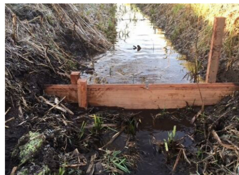
Stuw in Wuustwezel voor beter waterbeheer