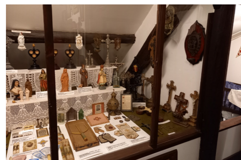
'Zalige' vondsten bij heemkring De Drie Rozen in Schilde

Binnen het project Interreg CANAPE versterkten we de samenwerking met de landbouw met negen maatregelen voor beter agrarisch waterbeheer in de omgeving van de Kalmthoutse Heide. Klimaat krijgt extra aandacht binnen de werking van Regionaal Landschap de Voorkempen met de nieuwe projecten 'Stille waters, diepe gronden' en 'Drempels tegen de droogte'.