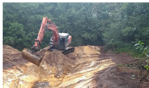
Poelen graven voor meer amfibieën